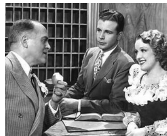
1937 HOLLYWOOD HÔTEL (Hollywood Hotel) de Busby Berkeley avec Rosemary Lane