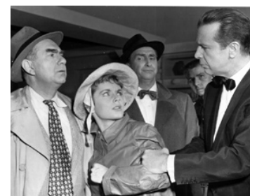
1954 SUZANNE DÉCOUCHE (Susan slept here) de F. Tashlin avec Horace McMahon, Debbie Reynolds