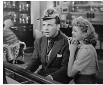
1938 LE CAVALIER ERRANT (Going places) de Ray Enright avec Anita Louise