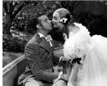
1935 CHERCHEUSES D'OR 1935 (Gold Diggers of 1935) de Busby Berkeley avec Gloria Stuart