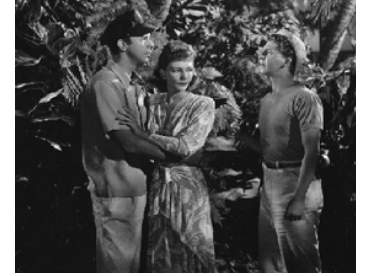
1942 TRINIDAD COCKTAIL (Happy go lucky) de C. Bernhardt avec Mary Martin, Rudy Vallee