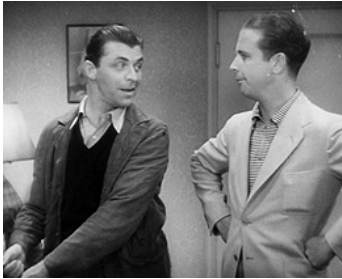
1933 COLLEGE COACH de William A. Wellman avec Lyle Talbot