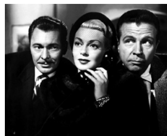
1952 LES ENSORCELÉS (The Bad and the Beautiful) de V. Minnelli avec Barry Sullivan, Lana Turner