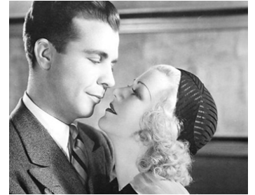
1934 ONDES D'AMOUR (Twenty Millions Sweethearts) de R. Enright avec Ginger Rogers