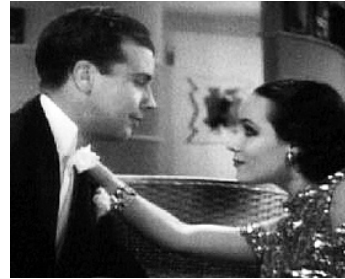
1934 LE BAR MAGNIFIQUE (Wonder Bar) de Lloyd Bacon avec Dolores del Rio