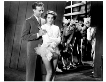
1933 PROLOGUES (Footlight Parade) de Lloyd Bacon avec Ruby Keeler