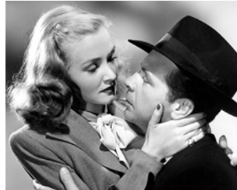
1946 L'HEURE DU CRIME (Johnny O'Clock) de Robert Rossen avec Evelyn Keyes