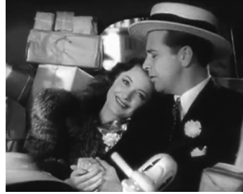
1940 LE GROS LOT (Christmas in July) de Preston Sturges avec Ellen Drew