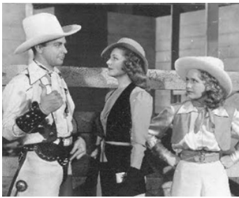
1938 JOYEUX COMPÈRES (Cowboy from Brooklyn) de L. Bacon avec Priscilla Lane, Ann Sheridan