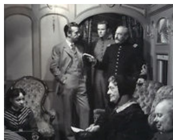
1951 LE GRAND ATTENTAT (The tall Target) d'Anthony Mann avec Adolphe Menjou