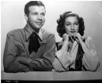
1942 LE RODÉO DE L'AMOUR (Riding high) de George Marshall avec Dorothy Lamour