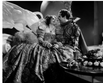
1935 SONGE D'UNE NUIT D'ÉTÉ (A Midsummer night's dream) de W. Dieterle avec O. De Havilland