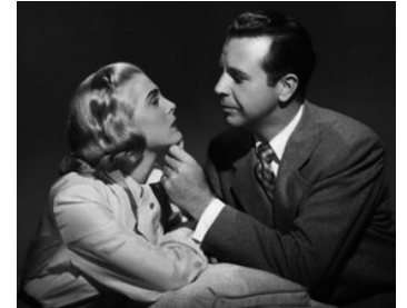
1948 SANGLANTE AVENTURE (Pitfall) d'André de Toth avec Lizabeth Scott