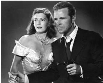
1945 PRIS AU PIÈGE (Comered) d'Edward Dmytryk avec Micheline Chéirel