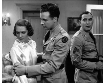
1934 MADEMOISELLE GÉNÉRALE (Flirtation Walk) de Frank Borzage avec Ruby Keeler, Pat O'Brien