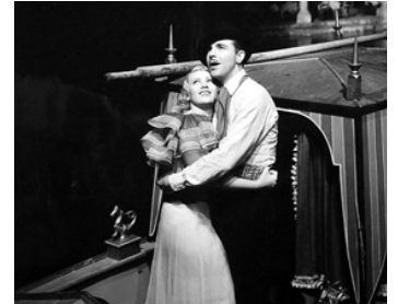
1935 LE GONDOLIER DE BROADWAY (Broadway Gondolier) de Lloyd Bacon avec Joan Blondell