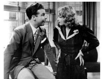
1936 EN PARADE (Gold Diggers of 1937) de Lloyd Bacon avec Glenda Farrell