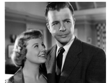
1950 TOURMENT (Right Cross) de John Sturges avec June Allyson