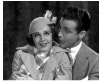
1933 CHERCHEUSES D'OR (Gold Diggers of 1933) de Mervyn LeRoy avec Ruby Keeler