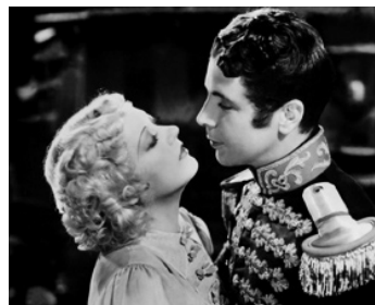
1936 BETSY (Hearts divided) de Frank Borzage avec Marion Davies