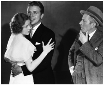
1932 THE KING'S VACATION de John G. Adolfi avec Patricia Ellis, George Arliss