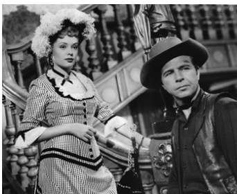
1948 LA CITÉ DE LA PEUR (Station West) de Sidney Lanfield avec Jane Greer