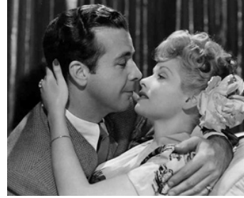
1944 MEET THE PEOPLE de Charles Reisner avec Lucille Ball