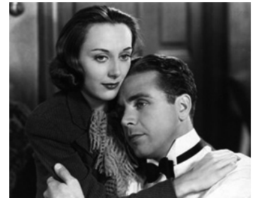
1935 VOTEZ POUR MOI (Thanks a Million) de Roy del Ruth avec Ann Dvorak