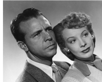
1947 OPIUM (To the Ends of the Earth) de Robert Stevenson avec Signe Hasso