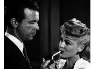
1944 ADIEU MA BELLE (Murder, my sweet) d'Edward Dmytryk avec Claire Trevor