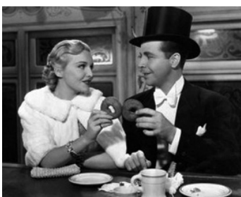
1936 SUR L'AVENUE (On the Avenue) de Roy del Ruth avec Madeleine Carroll