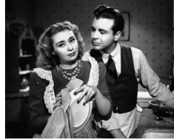
1941 UNE FEMME MODÈLE (Model Wife) de Leigh Jason avec Joan Blondell