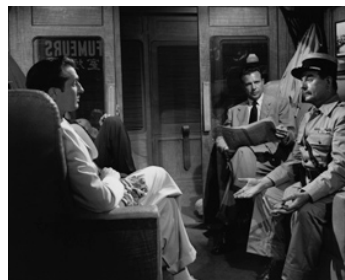
1948 LÉGION ÉTRANGÈRE (Rogues' Regiment) de R. Florey avec Vincent Price, Frank Conroy