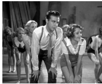
1933 42e RUE (42nd Street) de Lloyd Bacon avec Ruby Keeler