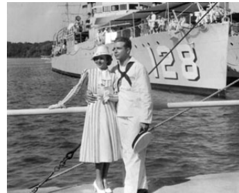
1935 AMIS POUR TOUJOURS (Shipmates Forever) de Frank Borzage avec Ruby Keeler