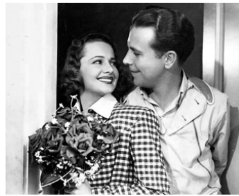
1938 UNE ENFANT TERRIBLE (Hard to get) de Ray Enright avec Olivia de Havilland