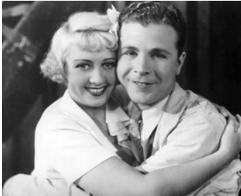
1934 DAMES (Dames) de Ray Enright avec Joan Blondell