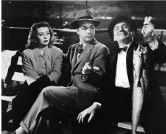
1940 JE VEUX DIVORCER (I want a Divorce) de Ralph Murphy avec Joan Blondell, H. Davenport