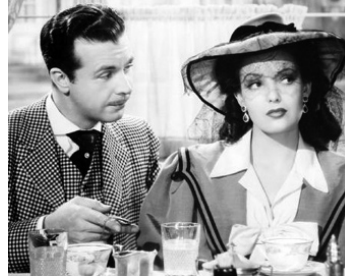
1943 C'EST ARRIVÉ DEMAIN (It happened tomorrow) de René Clair avec Linda Darnell