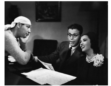
1939 FAUSSES NOTES (Naughty but nice) de R. Enright avec Maxie Rosenbloom, Gale Page