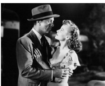
1950 L'IMPLACABLE (Cry Danger) de Robert Parrish avec Rhonda Fleming