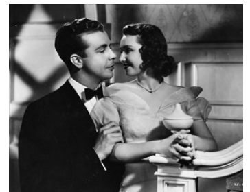
1937 LA REVUE DU COLLÈGE (Varsity Show) de William Keighley avec Priscilla Lane