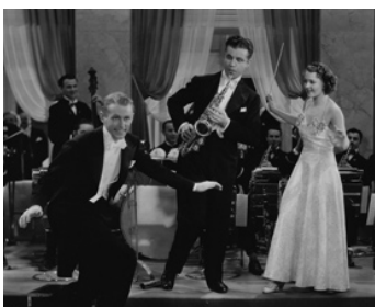
1936 COLLEEN (Colleen) d'Alfred E. Green avec Paul Draper, Ruby Keeler